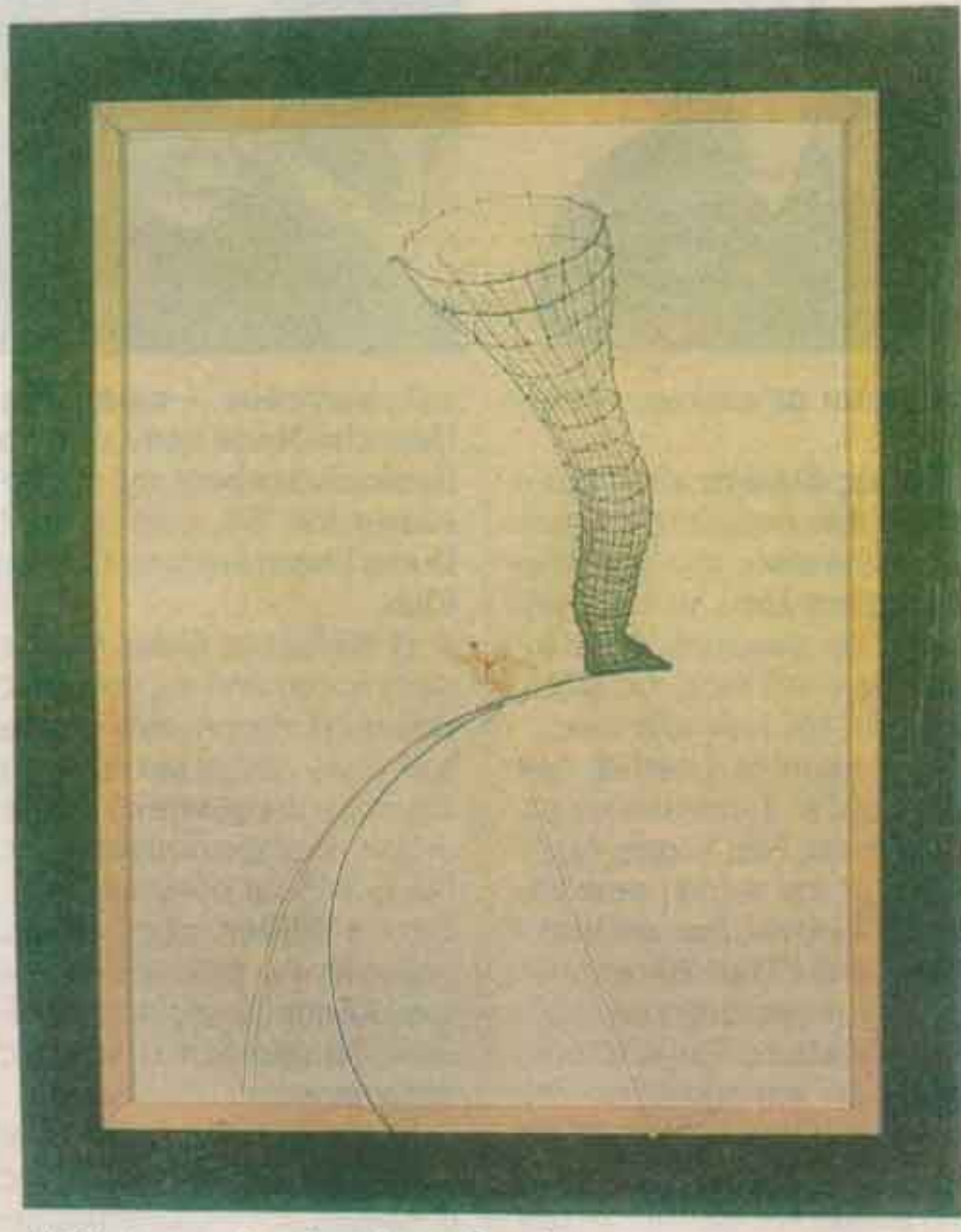
«Untitled», του Αγγελου Αντωνόπουλου