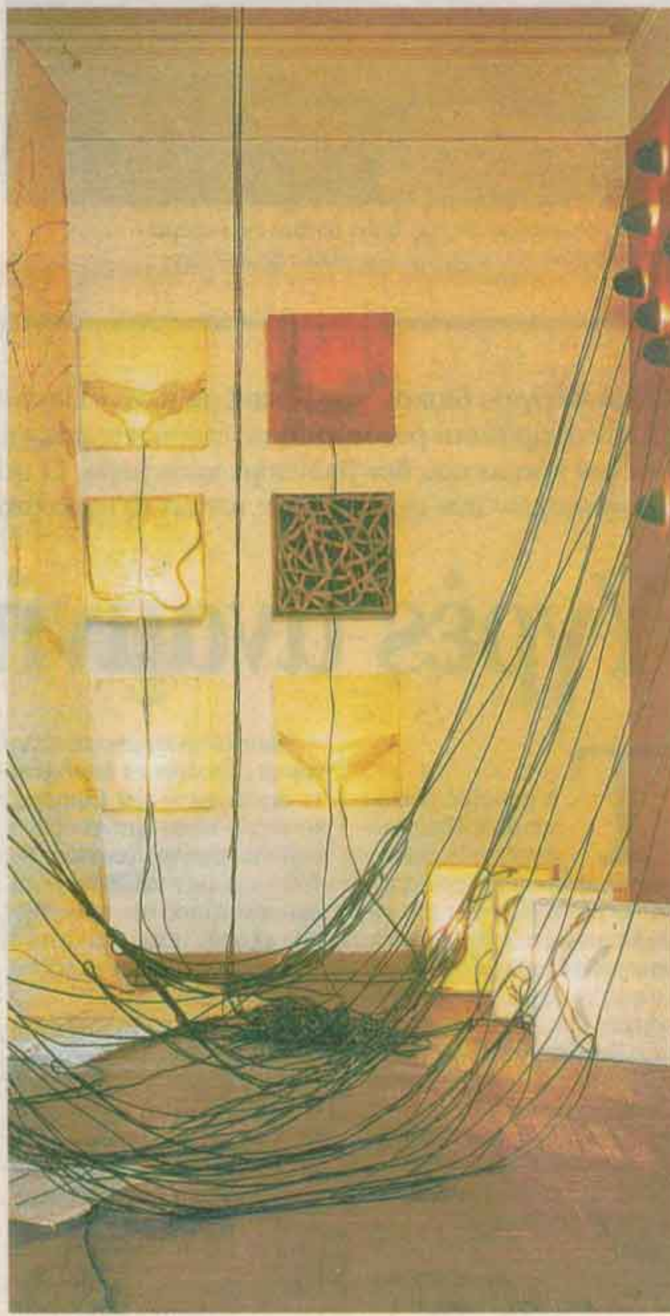
«Silent Synapses», της Εφης Χαλυβοπούλου