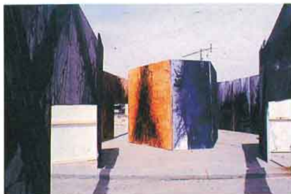
"Πολύπτυχο", 1987, Ακρυλικό σε μουσαμά, 40X2