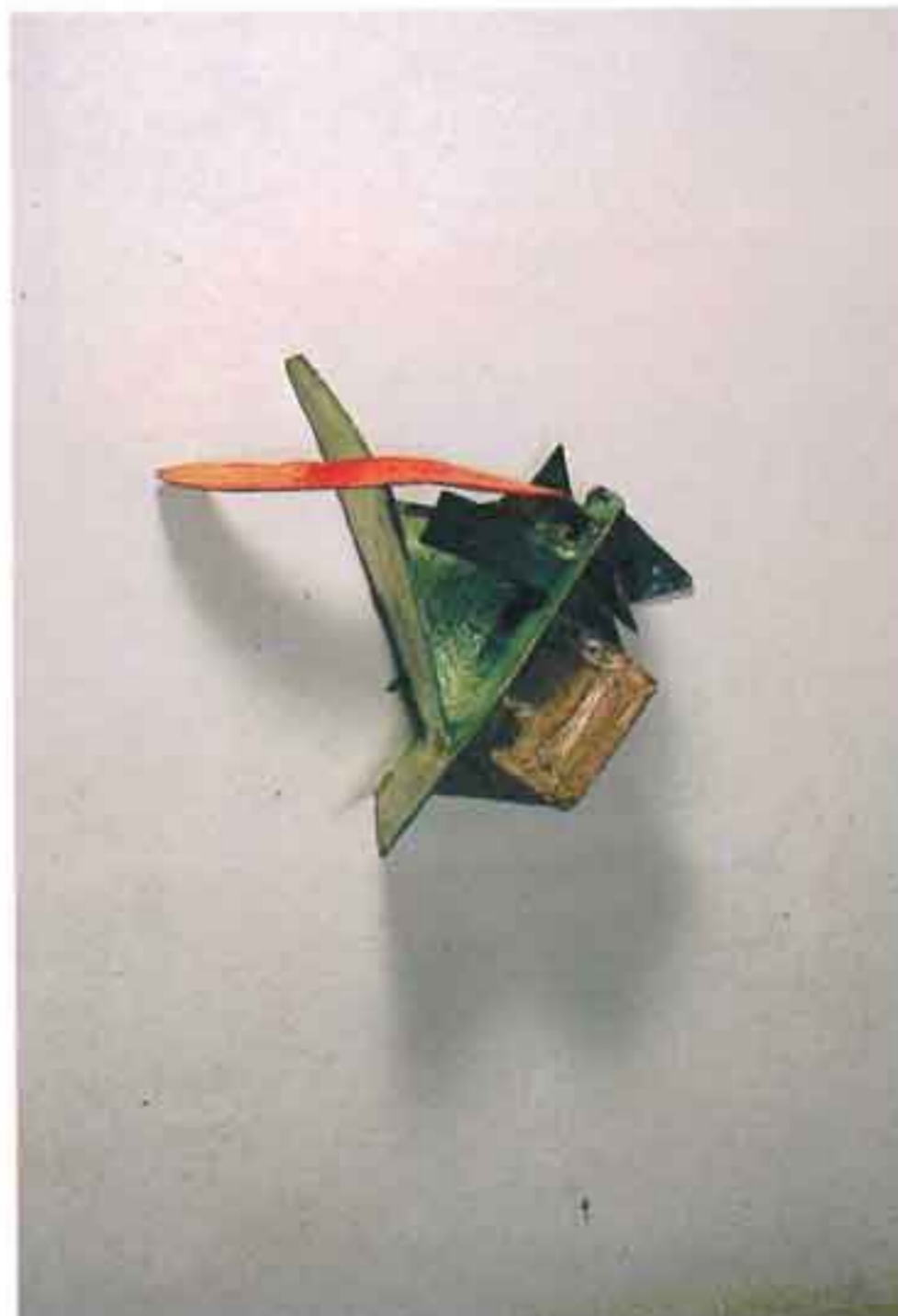
"Λιβάδι με Φεγγάρι", 1991, Ακρυλικό σε ξύλο , 80X45X42