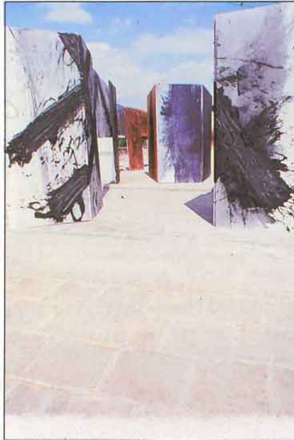
"Πολύπτυχο", 1988, 40X2, Ακρυλικό σε μουσαμά

Οι μετασχηματισμοί τους εναλλάσσουν οπτικές παραλλαγές, δημιουργούν συμβιωτικές καταστάσεις και διαμορφώνουν αναπτύγματα μέσω των οποίων προβάλλονται υλικό και ιδέες. Έτσι τη συλλογιστική της σύλληψης, καρπό εμπειρικών παρατηρήσεων και εσωτερικής διεργασίας, ακολουθεί η οργανική διατύπωση με διαδικαστικούς συσχετισμούς και δημιουργικές μεταβολές. Οι οργανικές λειτουργίες και οι δομικές σχέσεις ξεπηδώντας από τις επιφάνειες των έργων στο χώρο, καθορίζουν μ' αυτόν μια διαλεκτική ισορροπία στην προσπάθεια να διατυπωθεί ένα συμβάν ή μια ιστορία,