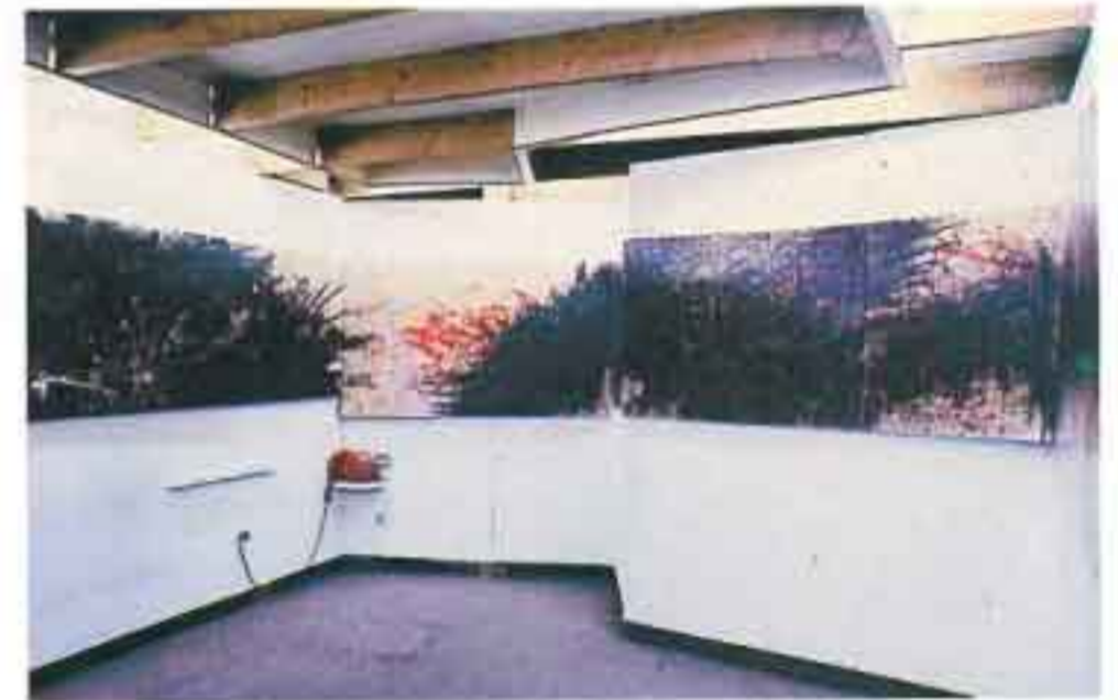
Φρίζα 2, 1986 ,Ακρυλικό σε μουσαμά, 19X0.9