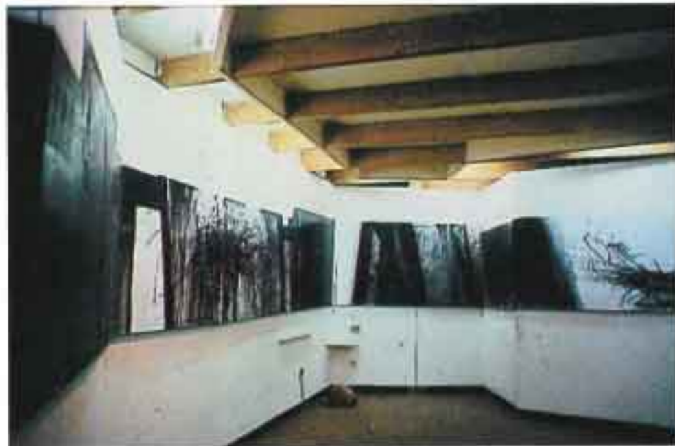
Φρίζα 1, 1985, Ακρυλικό σε μουσαμά, 19X0.9