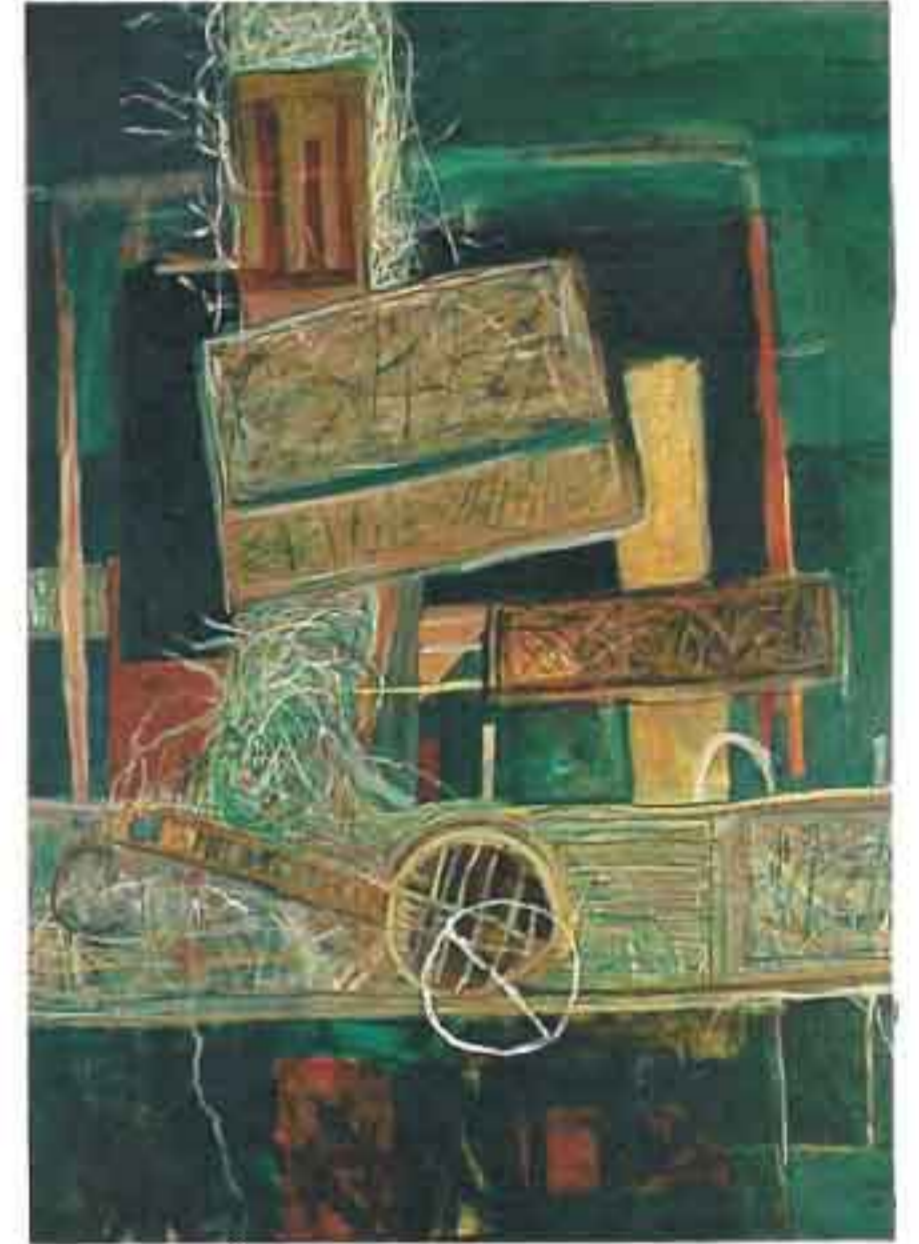
Αναφορά στον Σ... , 1990 , Ακρ. σε μουσαμά, 80X140