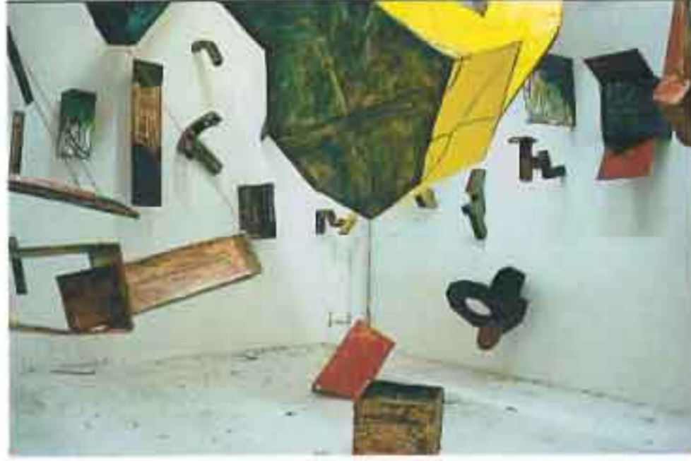
"Δωμάτιο με αντικείμενα," 1991-1992