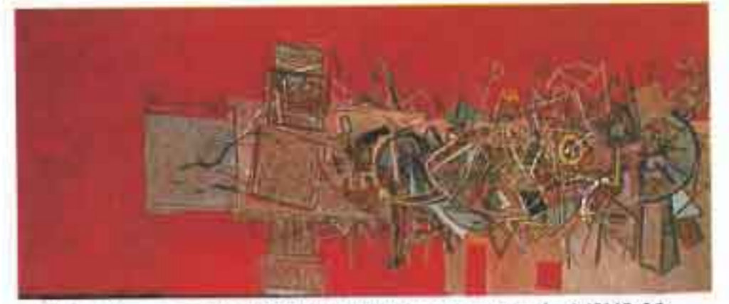
"Το κόκκινο πανί", 1990, Ακρυλικό σε μουσαμά, 1.10X2.20