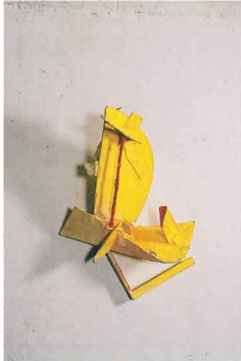
"Πόλις", 1990, Ακρυλικό σε χαρτί και ξύλο, 60X30X95