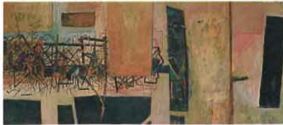
Αιώρα., 1989, Ακρυλικό σε μουσαμά, 90X200