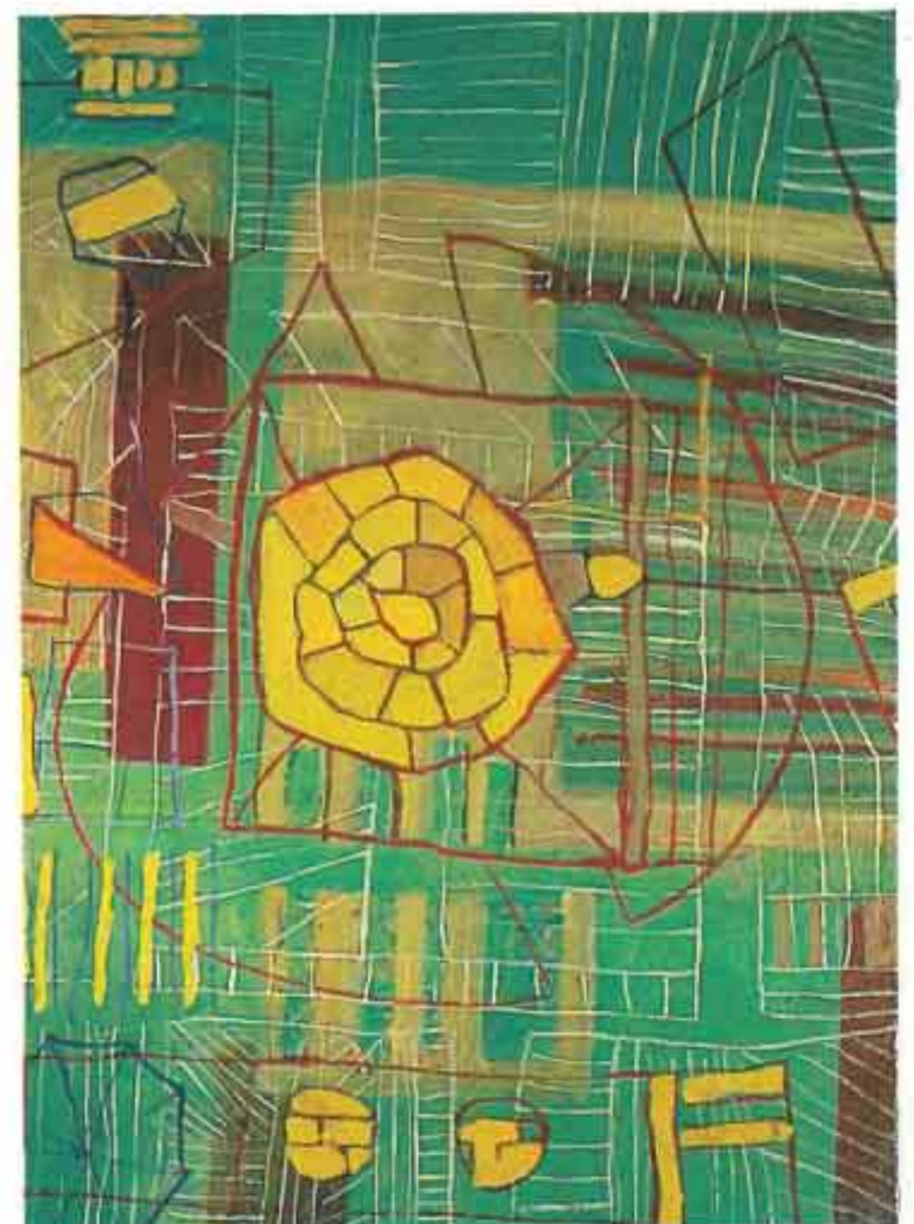
Η πόλις έτσι όπως ... , 1990, 180X223 , Ακρυλικό σε μουσαμά