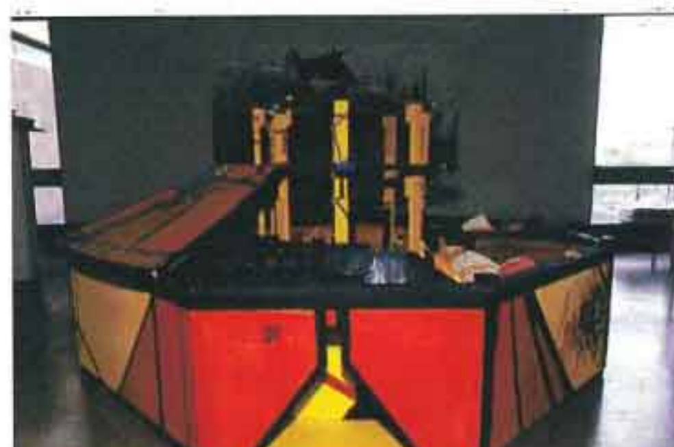
'Ασπίδα του Αχιλλέα", 1988 , Ακρυλικό σε ξύλο, 2X2X0.9