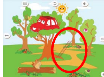
Εικόνα 4. Η σκάλα πέφτει ενώ προτείνεται ως λύση να γίνει η Κοκκινομπαλού δεντρόσιτο (αδικαιολόγητη εισβολή στην ιστορία)

Ο ελλιπής τρόπος αξιοποίησης θερμών σημείων, η απουσία τους σε κάποια σημεία της ιστορίας ή η παρουσία τους ως αδικαιολόγητων εισβολών στην ιστορία αποτυπώνονται κατά την αλληλεπίδραση εκπαιδευτικού – μαθητών, καθώς είτε αποσπούσαν τα παιδιά από σημαντικές λεπτομέρειες της ιστορίας (όπως για παράδειγμα στην ερώτηση σχετικά με τους τρόπους αξιοποίησης του αυτοκινήτου μετά την απόσυρσή του, μόνο ένας μαθητής ανέφερε τη μετατροπή του σε δεντρόσιτο, καθώς οι υπόλοιποι επικεντρώθηκαν στην πτώση της σκάλας) είτε δεν κέντρισαν το ενδιαφέρον τους, ώστε να αποτελέσουν αφορμή για αναζήτηση περισσότερων πληροφοριών και περαιτέρω γνωστικών διερευνήσεων από την πλευρά των μαθητών παρά μόνο μετά από προτροπή της νηπιαγωγού (ενδεικτικά αναφέρεται η εικόνα ενός σεφ με μια γαλλική σημαία στο πουκάμισό του ενημερώνοντας για τον τόπο «γέννησης» του αυτοκινήτου, αλλά και η παρουσίαση του χάρτη της Ελλάδος επί του οποίου κινείται το αυτοκίνητο χωρίς, όμως, να σταματά στις πόλεις- προορισμούς της οικογένειας ή να παρουσιάζει χαρακτηριστικά αξιοθέατά τους).