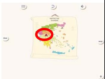
Εικόνα 3. Το αυτοκίνητο μετακινείται στον χάρτη χωρίς να σταματήσει στους αναφερόμενους προορισμούς (ελλιπής τρόπος αξιοποίησης)

Γενικότερα, η ψηφιακή εικονογράφηση, παράλληλα με τα ηχητικά εφέ και τη μουσική, λειτουργούν τις περισσότερες φορές βοηθητικά στην κατασκευή νοήματος, όπως για παράδειγμα η εικόνα που παρουσιάζει την ποικιλία παιχνιδιών που υπήρχαν στο εσωτερικό του αυτοκινήτου που, σε συνδυασμό με τη μουσική που παραπέμπει σε λούνα παρκ, υποδηλώνει πόσο ευχάριστα περνούν τα παιδιά κατά τη διάρκεια των ταξιδιών, η εικόνα με την επιστολή του Υπουργείου Συγκοινωνιών συνδυασμένη με τη μουσική επένδυση, που προετοιμάζει για την ανακοίνωση κάποιου σοβαρού γεγονότος, και η λυπητερή μουσική, που συνοδεύει την αποτύπωση του μέλλοντος του αυτοκινήτου, που θα αποσυρθεί. Ως προς τα θερμά σημεία, επισημαίνεται πως δεν εντοπίζονται σε κάθε σελίδα και πως τα περισσότερα μπορούν να χαρακτηριστούν ως αδικαιολόγητες εισβολές στην ιστορία, μη βοηθητικά στην κατασκευή του νοήματος ή ελλιπή ως προς τον τρόπο αξιοποίησής τους.