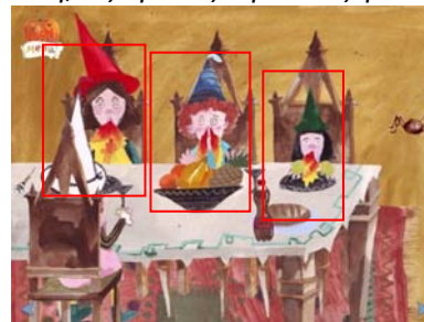
Εικόνα 2. Η καυτερή σούπα της Μπέτση κάνει τους φίλους της να βγάζουν φλόγες

Σημειώνεται πως τα θερμά σημεία εικόνων κρίνονται ως απαραίτητα, υποστηρικτικά ή βοηθητικά στην κατανόηση της ιστορίας, με ελάχιστες εξαιρέσεις (η αλλαγή στους χρωματισμούς των φιαλιδίων που βρίσκονται δίπλα από το τσουκάλι της Μπέτση). Το ίδιο ισχύει και για τα ηχητικά εφέ και τη μουσική, που συνεπικουρούν στην κυριολεκτική και συνεπαγωγική κατανόηση της ιστορίας, όπως π.χ. οι φωνές της Μπέτση, όταν γίνεται διακοπή ρεύματος, και δηλώνουν την απόγνωση της, οι στριγκλιές των φίλων της μάγισσας, όταν γεύονται την καυτερή σούπα και το ηχητικό εφέ που δηλώνει τη σωστή επιλογή τουμανιταριού-τσιλι και στα οποία εστίασε την προσοχή των νηπίων η εκπαιδευτικός.